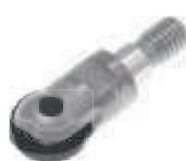
Twister 06 pag. F 53