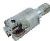
Twister 31 pag. F 56