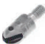
Twister 16 pag. F 55