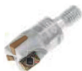
Twister 01 pag. F 50