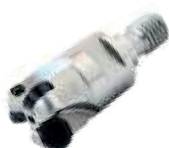
Twister 04 pag. F 52