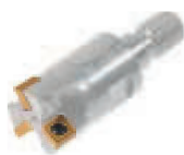
Twister 11 pag. F 54