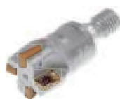
Twister 03 pag. F 51